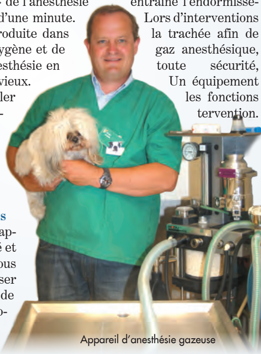
Appareil d'anesthésie gazeuse

Nos protocoles anesthésiques sont personnalisés : nous les adaptons en fonction de l'état de santé et de l'âge de votre animal. Nous vous conseillons également de réaliser un bilan sanguin , qui permettra de mettre en évidence des pathologies qui pourraient sinon passer inaperçues.