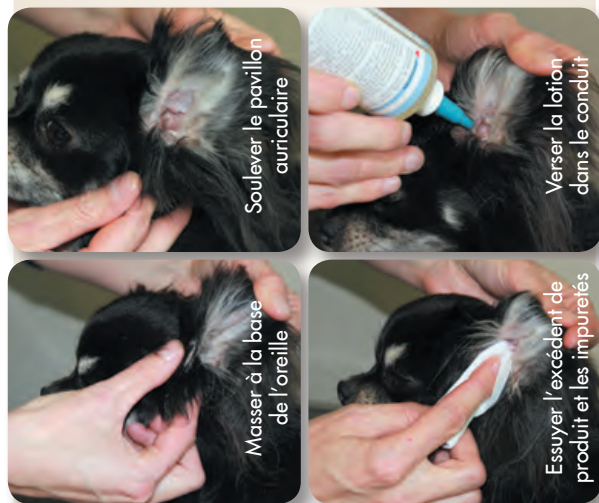
Soulever le pavillon auriculaire