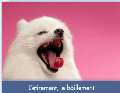
L'étirement, le bâillement