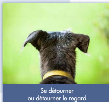
Se détourner ou détourner le regard