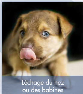
Léchage du nez ou des babines