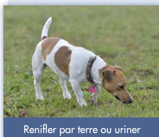
Renifler par terre ou uriner